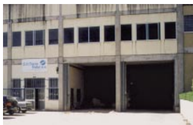
■ Sede actual de TransNatur en Porto.

Nuestra sede de Porto va a adquirir, próximamente, una nuevas instalaciones de 2.000 m 2 para un proyecto ambicioso del cual auguramos grandes éxitos.