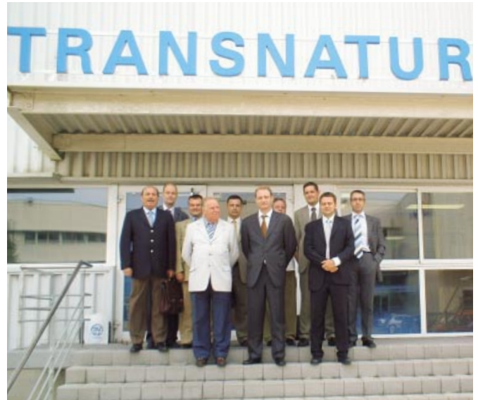
■ Militzer & Münch de Marruecos en nuestras instalaciones.

Es a esta delegación a la que todos debemos mirar y aprender para lograr el éxito que todo su equipo ha logrado a lo largo de estos años de colaboración con Militzer & Münch, un mercado tan complejo y tan importante a la vez. □