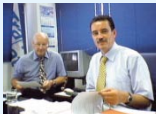
■ BTG Alemania.