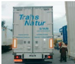
■ El primer camión directo TransNatur pisando Túnez.

TransNatur ha sido pionero en España en efectuar la primera salida directa desde Barcelona con destino Túnez, toda la gestión es elaborada, seguida y controlada desde TransNatur Alicante, con la eficiencia que les caracteriza. □