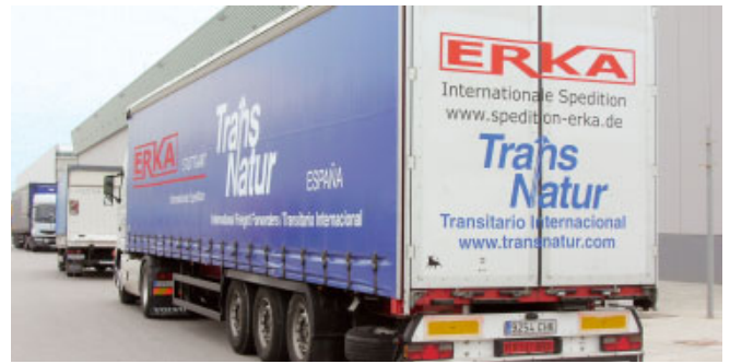
El primer camión pintado TN/Erka, agente de Stuttgart