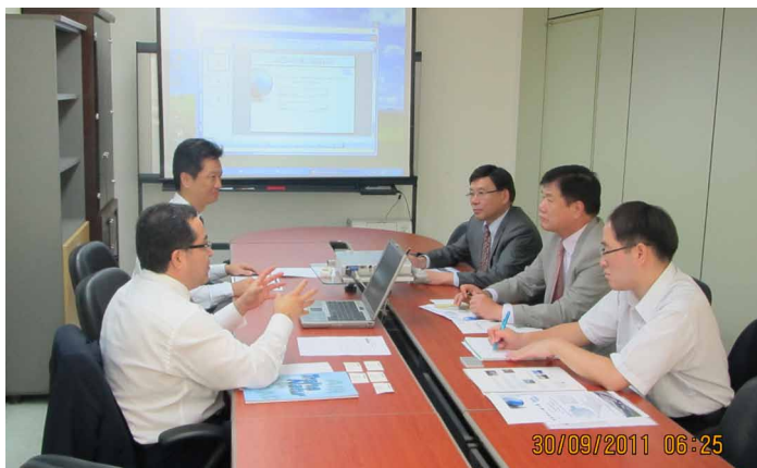
VISITA HANKYU HANSHIN JAPÓN

La visita se ha realizado con el Director general de Hankyu Corea y los directores de marítimo y aéreo en Busan que es la oficina central. Durante la reunión se han definido las bases de colaboración y desarrollo para 2012 no sólo a nivel comercial sino también operativo.