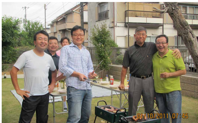
VISITA HANKYU HANSHIN JAPÓN

Asimismo se han estrechado los vínculos con los directores de esta empresa ya que nuestra relación con ellos, hasta ahora, se ha desarrollado más en otros países como Taiwán, Singapur y Corea este año, por lo que nuestra presencia ha servido para reforzar nuestra imagen con la Dirección General de Hankyu Hanshin Express Japón.